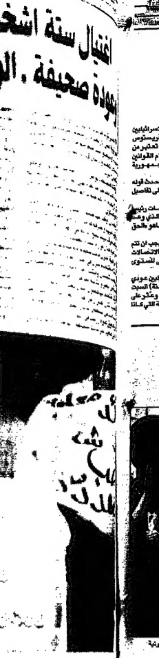
البيعت عن ذراع